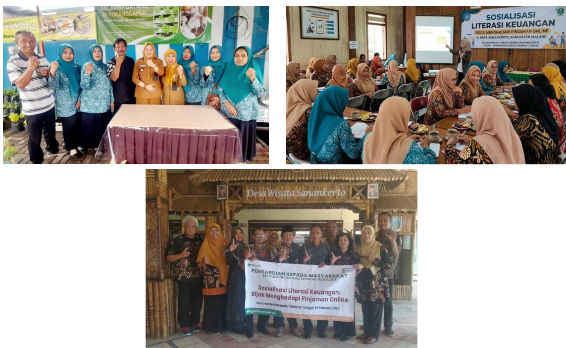
Gambar 3. Photo kegiatan sosialisasi