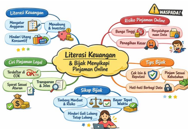
Gambar 1. Materi Presentasi Literasi Keuangan