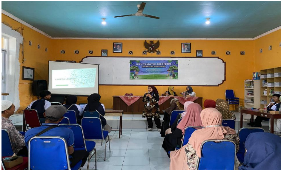
Gambar 2. Sosialisasi Fintech Lending

Setelah narasumber menjelaskan tentang seluk beluk fintech lending , maka sesi selanjutnya adalah diskusi dan tanya jawab dengan peserta. Pada sesi ini tiga orang peserta mengajukan pertanyaan. Pertanyaan pertama terkait dengan risiko jika peserta gagal membayar angsuran pinjaman online . Peserta kedua menanyakan tentang perbandingan suku bunga pinjaman online dengan suku bunga bank. dan Pertanyaan terakhir terkait tips agar dapat menggunakan pinjaman online ( fintech lending ) secara bijak.