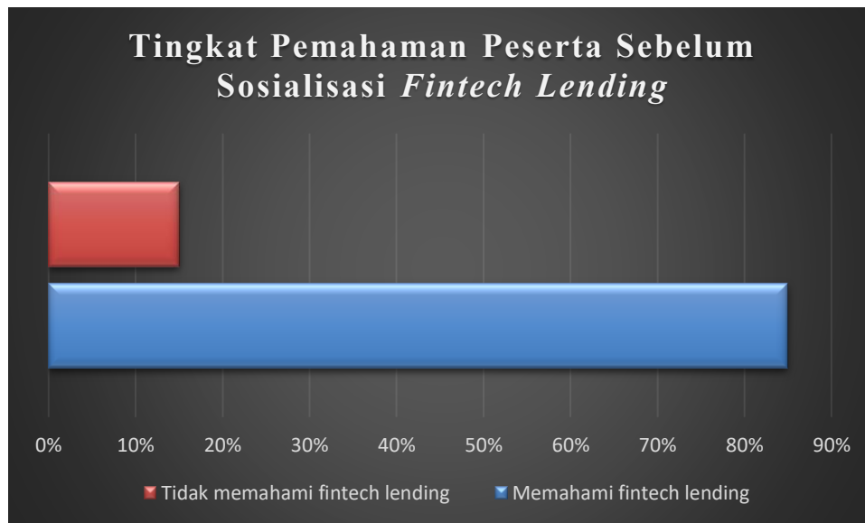
Gambar 1. Tingkat Pemahaman Peserta Sebelum Sosialisasi Fintech Lending

pinjaman secara online . Selain itu, belum ada peserta yang menggunakan fasilitas fintech lending , hal ini disebabkan kekhawatiran terkait bunga yang tinggi dan risiko tidak dapat mengembalikan pinjaman.