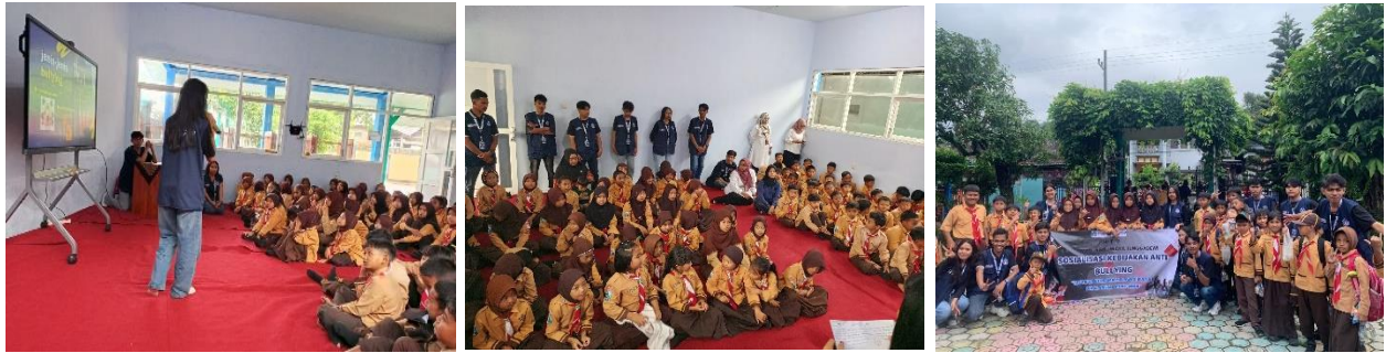
Gambar 3. Pelaksanaan Sosialisasi di SD Negeri 1 Tulungrejo

aktif dalam mencegah perundungan ketika melihat atau mengalaminya, baik di lingkungan sekolah maupun di luar sekolah.