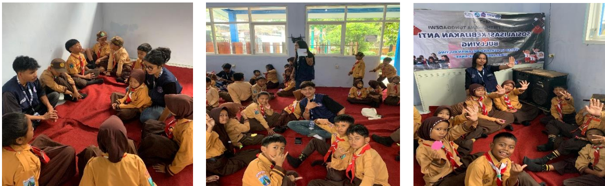
Gambar 4. Pelaksanaan Program “ Speak Up ”

Sebagai respons terhadap permasalahan tersebut, Program “ Speak Up Bersama Melawan Bullying ” di SD Negeri 1 Tulungrejo dirancang untuk meningkatkan kesadaran sekaligus mendorong perubahan perilaku siswa. Program ini dilaksanakan melalui beberapa kegiatan utama, yaitu: (1) penyampaian materi dan diskusi interaktif mengenai definisi, jenis, dan dampak perundungan; (2) kegiatan role-playing atau simulasi untuk melatih empati serta kemampuan merespons situasi perundungan; (3) pelatihan keterampilan sosial dan komunikasi yang efektif; (4) pembentukan “ Speak Up Club ” sebagai wadah siswa yang berperan sebagai peer educator; serta (5) penyusunan komitmen atau aturan anti-perundungan yang disepakati bersama oleh warga sekolah.