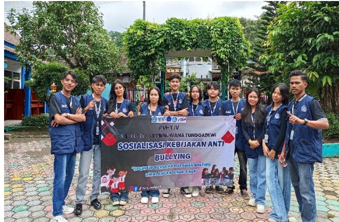
Gambar 2. Tim Unitri di Lapangan SD Negeri 1 Tulungrejo

Kegiatan pengabdian dalam bentuk sosialisasi kebijakan dengan sasaran anak-anak sekolah dasar dilaksanakan pada hari Jumat, tanggal 23 Januari 2026, bertempat di Sekolah Dasar Negeri 1 Tulungrejo, Kecamatan Ngantang, Kabupaten Malang. Tim pengabdian mengusung tema “Sosialisasi Kebijakan Pencegahan dan Penanganan Perundungan di Sekolah Dasar” sebagai bentuk respons terhadap kebijakan pemerintah yang menekankan pentingnya perlindungan anak serta penciptaan lingkungan pendidikan yang aman dan berkarakter.